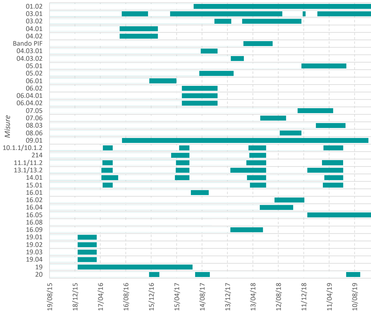
Fig. 1. Cronologie e durata (dalla pubblicazione alla scadenza) delle procedure di attuazione del PSR 2014-2020

In termini di domande presentate, le misure con maggiori riscontri sono state la 4.1 e la 6.1 per quanto riguarda le misure strutturali (Fig. 2), e la 13 e la 14 per quelle a premio (Fig. 3). Queste ultime sono state anche quelle che hanno prodotto la grande maggioranza delle domande ad oggi istruite, mentre risulta ancora largamente prevalente la quota di domande in istruttoria tra le misure strutturali, anche con riferimento a procedure avviate nel 2016.